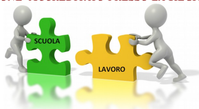
TABELLA DI COMPARAZIONE

ORGANISMO DI FORMAZIONE ACCREDITATO PRESSO LA REGIONE VENETO: COD. N. 218